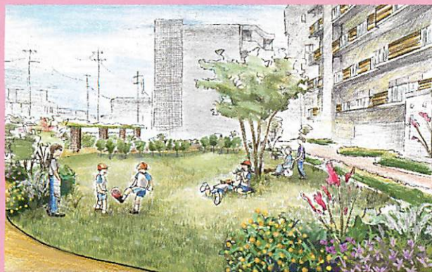
第34回 国土交通大臣賞 社会福祉法人玉美福祉会

地域のシンボリックな緑地として人と自然が共生する都市環境の形成、地域の活性化に寄与するプランを募集します。