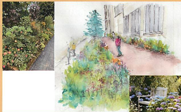
第34回 国土交通大臣賞 新潟医療福祉大学社会福祉学部社会福祉学科原口ゼミ

日常的な花や緑の活動を通して、地域の活性化や子どもたちへの情操教育、身近な環境の改善に寄与するプランを募集します。