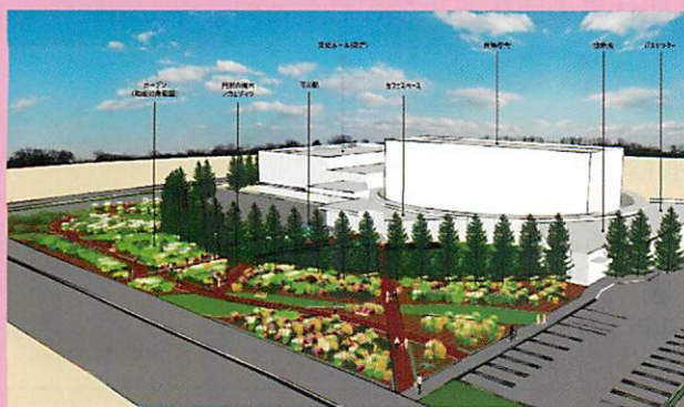
第34回 都市緑化機構賞 北海道東神楽町