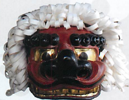
◀獅子頭(雄) 御厨神社 所蔵