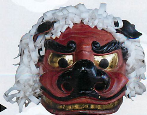
獅子頭(雌)▶ 御厨神社 所蔵

松阪の夏の風物詩・祇園祭は、「初午大祭」、 「氏郷祭り」と並ぶ松阪三大祭のひとつで、毎年7月中旬に盛大に行われています。疫病退散を祈願したのがはじまりとされる祇園祭。その祭礼が、時代とともに移り変わる様子を貴重な資料を通してご紹介します。