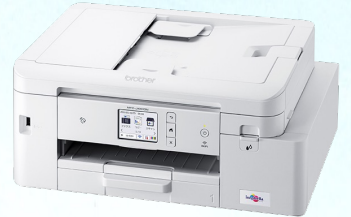
FAX機能付き大容量インクジェット複合機 (ブラザー: MFC-J4443N)