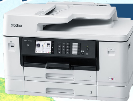
自動両面A3対応ハイスペック複合機 (ブラザー: MFC-J7300CDW)