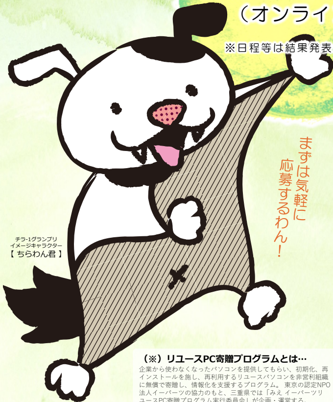
チラ-1グランプリ イメージキャラクター 【ちらわん君】