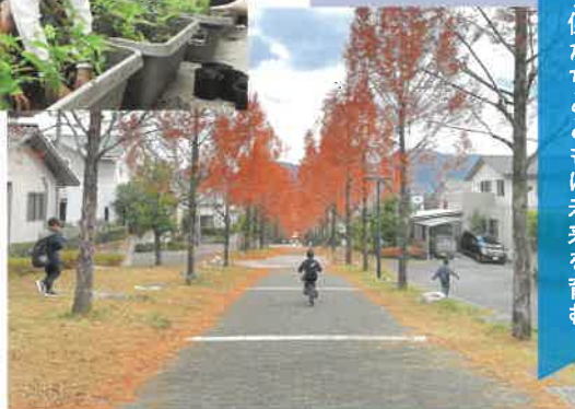
2025年度 住まいのまちなみ賞 みどり坂町内会(広島県広島市安芸区)