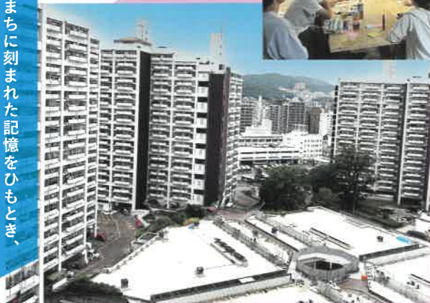
2025年度 住まいのまちなみ賞 6コア自治会(広島県広島市中区)