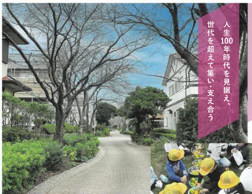
2025年度 国土交通大臣賞 特定非営利活動法人きやまSGK(佐賀県三養基郡基山町)