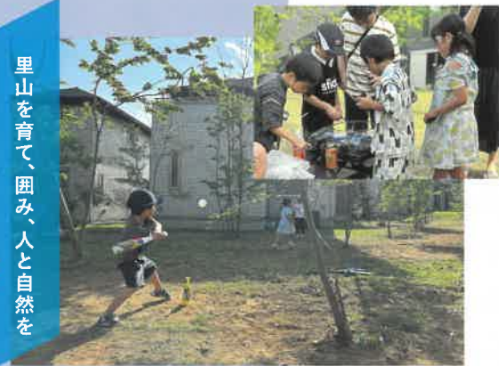
2025年度 住まいのまちなみ賞 つなく森みらい平自治会(茨城県つくばみらい市)