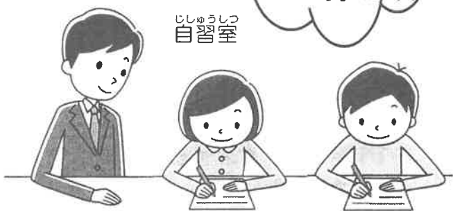
じじゅうしつ 自習室