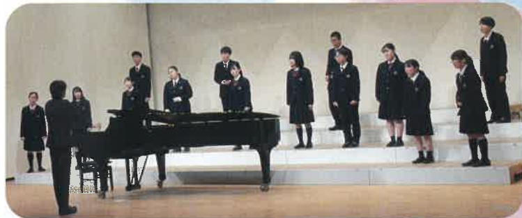
三重中学校・三重高等学校の合唱部