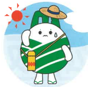
三重大学マスコット キャラクター ミールド